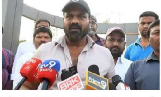
థియేటర్ల సమస్యలంటూ మాట్లాడుకుంటున్నాం. కానీ, నాకు తెలిసి గురుపూగారు ఎప్పుడో దీనికి ఓ మార్గం చూపించారు. ఏదాదికీ పది నుంచి పదిహేను సినిమాలు చేస్తూ.. ఎంతో మందికి ఉపాధి లభించేలా చేశారు. ఎప్పుడో ఓ సినిమా చేయటం కాదు. ఎప్పుడూ సినిమా చేయాలని దాసరి అనేవారు. ఇకపై నాతో సహా అందరూ హీరోలు వీలైతేనేమి ఎక్కువ సినిమాలు చేయాలని కోరుతున్నాం. ఆ బాధ్యత అందరిపైనా ఉంది. దాసరి ఘోషన పార్కీలా కాకుండా చుట్టు పక్కల పిల్లలు ఆడుకునేలా తీర్చిదిద్దితే బాగుంటుందని అనుకుంటున్నా" అని అన్నారు.